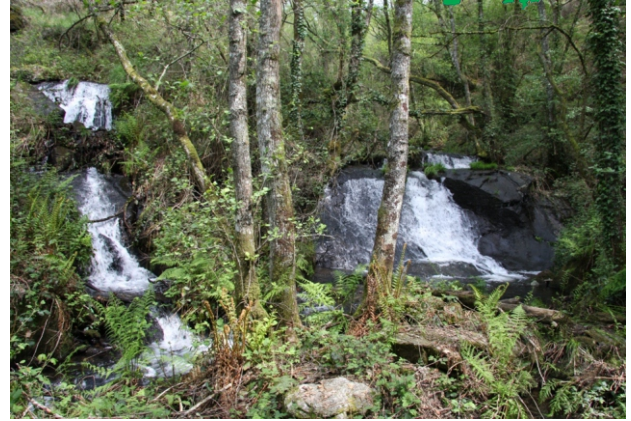
Fervenza de Porto Marcelín