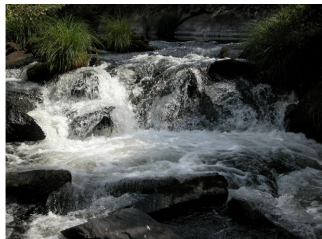
O Arnego in Toiriz

Pola estrada de Agolada a Vila de Cruces, despois de pasar Brántega chégase e unha ponte que cruza o río onde hai unha área recreativa. Desde alí séguese polas beiras.